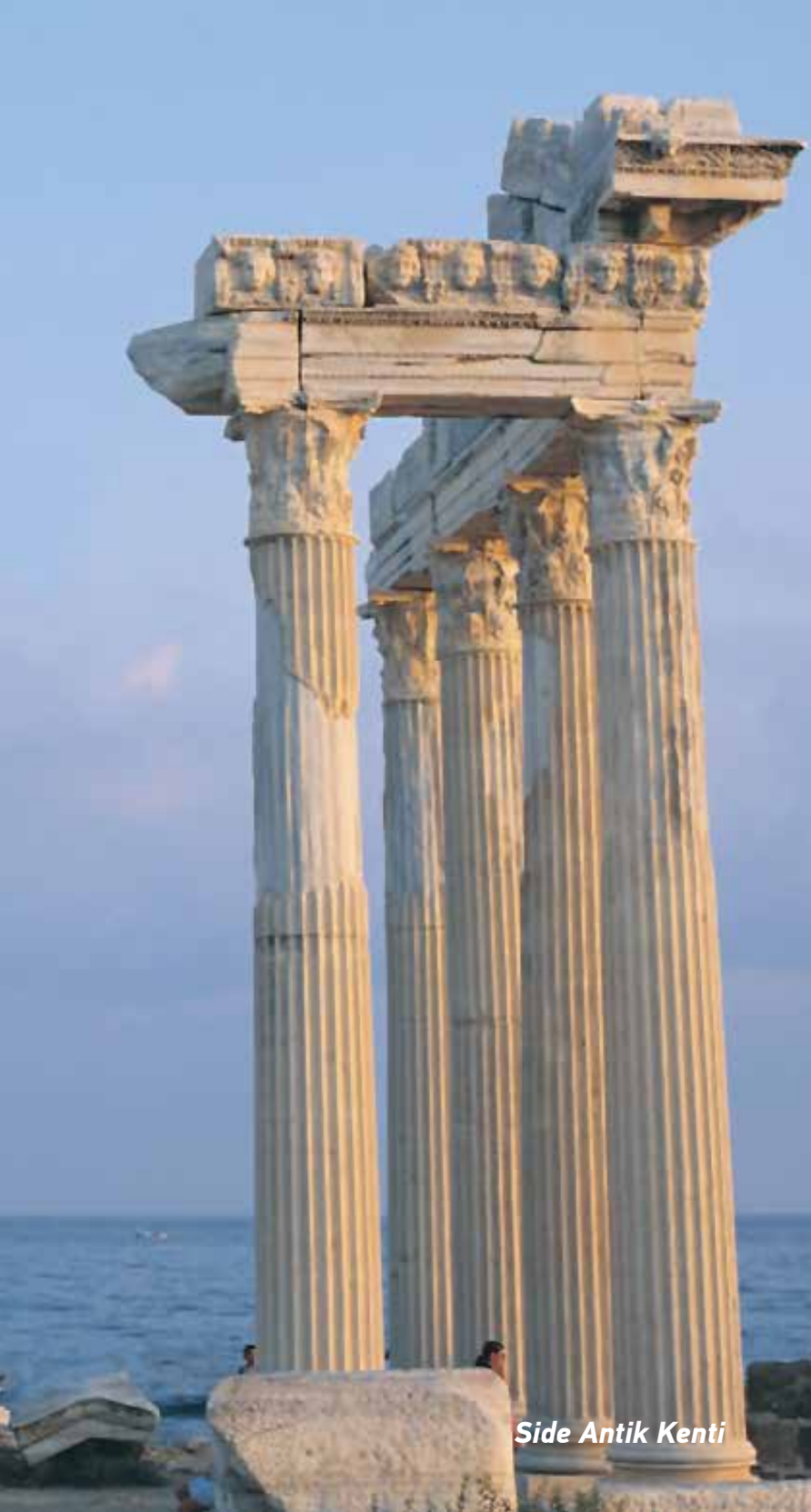
Side Antik Kenti