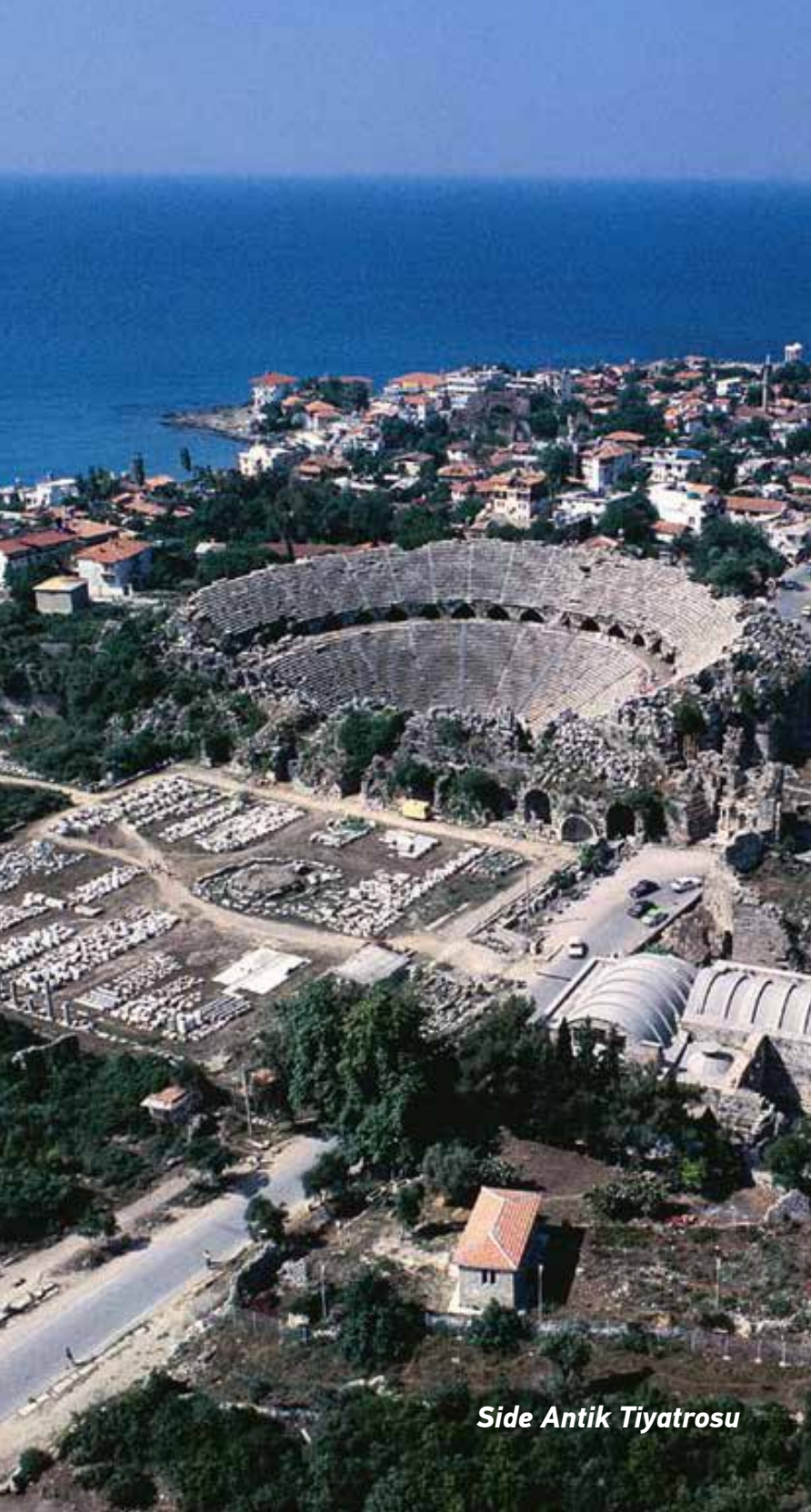
Side Antik Tiyatrosu